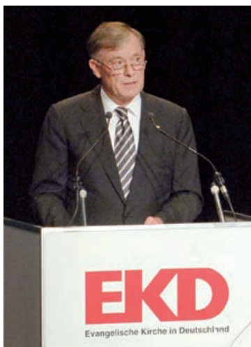
Bundespräsident Horst Köhler während einer Rede auf der Synode der Evangelischen Kirche in Deutschland (EKD).